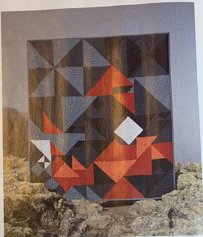
À droite: quilt en patchwork A.P.C. x Jessica Ogden.

déstocqueur déblayant des hangars entiers à l'aide de semi-remorques dont les contenus sont ensuite expédiés à des usines de fast fashion à l'autre bout du monde.